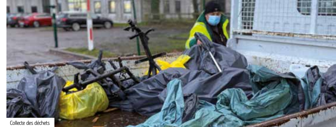
Collecte des déchets